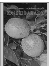
A metszés részletes szabályait Nyírázó Ferenc-Sarany Dézsi: Kajsziabarack című könyvében (Mezőgazdasági Kiadó, Budapest, 1981) olvashatjuk el.

A kajsziabák a szőlővel azonos talajokat kedvelik; a homokon és az agyagtalajokon egyaránt megélnék. Kezdetben felfelé törekvő, később ellaposodó, ernyőszerű koronát fejlesztenek, ezért legalább 6x6 méteres tenyésztőterületre (36 m 2 ) van szükségük. A lombkorona nem ad mély árnyékot, ezért a fák alatt a szamóca, sőt a zöldségfélék is megtermelhetők.